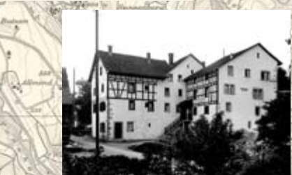
Schloss Langnau, vor dem Abbruch der neueren Anbauten im Jahr 1969.