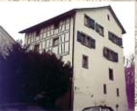
Schloss Langnau, heutiger Zustand.