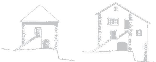
Schloss Langnau im Mittelalter und 1548.

⑤ Von der Schnabelburg Abstieg in die Schnabellücke. Der Fussweg über die Schnabellücke diente wohl bereits im Mittelalter als Saumweg. Die Wanderung folgt ihm auf einer kurzen Strecke Richtung Langnau.