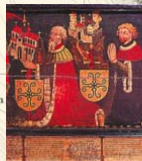
Stifterbild der Freiherren von Eschenbach von 1434, im Hintergrund die Schnabelburg.

Ausschnitt aus LK 1: 25 000.