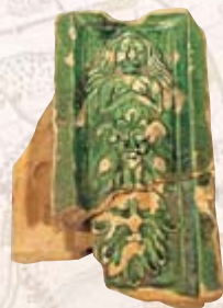
Ofenkachel aus dem 18. Jh., gefunden bei den Schnabelhöfen.