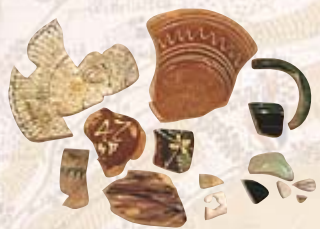
Geschirrkemik aus dem 18. Jh., gefunden bei den Schnabelhöfen.