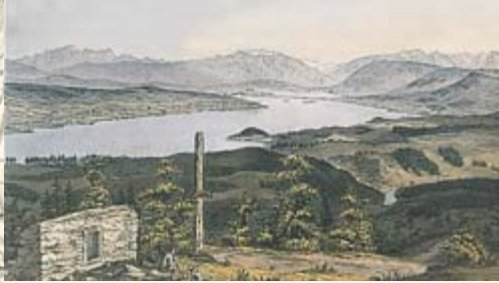
Schnabel mit Ruine der Hochwacht.