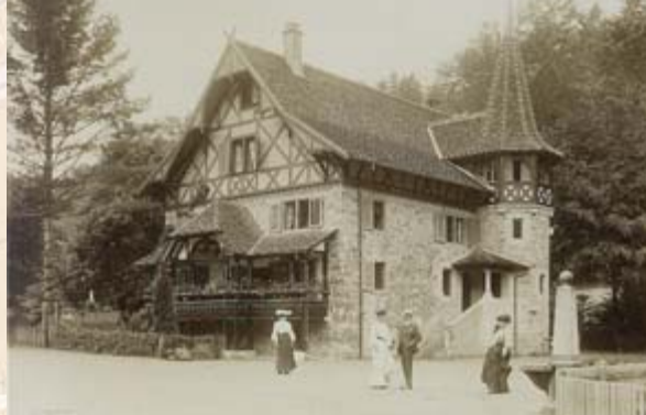
Der ehemalige Wohnsitz des «Sihlherrn», das Forsthaus.