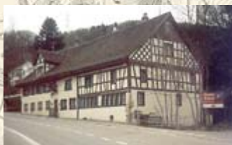
Das Wirtshaus Löwen wurde bereits 1526 erstmals erwähnt.