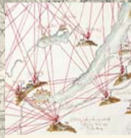
Karte der zürcherischen Hochwachten, 1743.