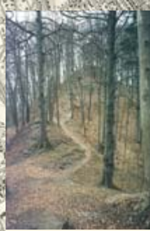
Aufstieg zur Schnabelburg.