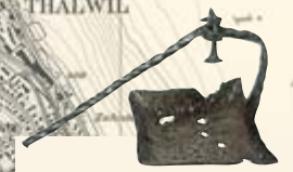
Eiserne Talglampe, 13. Jh. (Schweizerisches Landesmuseum)