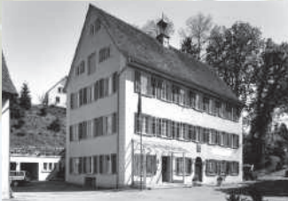
Das Rheinauer Gasthaus zum Salmen von 1691/92.