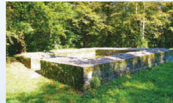
Römischer Wachturm Köpferplatz am Rhein.