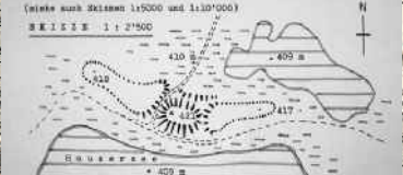
Skizze des befestigten Höhenzugs Langbuck beim Husemersee.