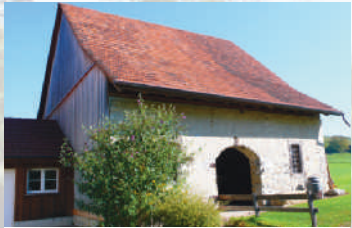
Burgrotte der ehemaligen Burg Wespertsbüel, 17. Jahrhundert.