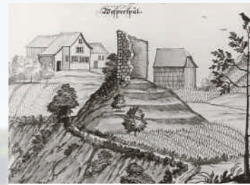
Burg Wespertsbüel, anonyme Federzeichnung 18. Jahrhundert.