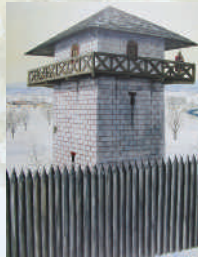
Rekonstruktion eines römischen Wachturms. (Ludwig Wamser 2000)