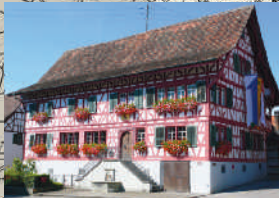
Marthalen, ehemaliges Gasthaus «Unterem Hirschen», heute Gemeindekanzlei, 1715.