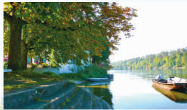
Alter Fährstandort in Ellikon am Rhein.