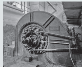
Spinnerei Blumer, Francis-Spiral- turbine mit horizontaler Welle von Escher Wyss, Zürich, 1918.