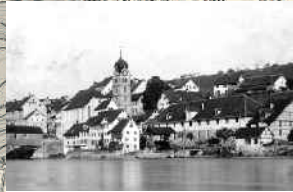
Die Kirche Eglisau von Osten, aufgenommen 1916.