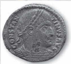
Römische Münze (Constantinus I., 306–337).