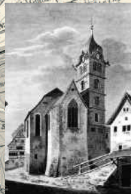
Die Kirche Eglisau in einer Tuschezeichnung von Ludwig Schulthess, erste Hälfte 19. Jh.