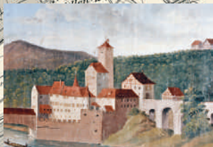
Ehemalige Burg und Landvogteischloss Eglisau 1765.