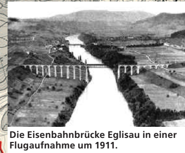
Die Eisenbahnbrücke Eglisau in einer Flugaufnahme um 1911.

Stadt Eglisau (2). Die 892 erstmals erwähnte Siedlung entwickelte sich unter den Freiherren von Tengen im 13. Jahrhundert zur Stadt. Wichtig war ihre Lage am Kreuzungspunkt der Wasserstrasse auf dem Rhein mit den Landstrassen von Schaffhausen und dem Klettgau nach Zürich. In Eglisau wurde das kostbare Salz aus Bayern und Tirol von den Lastkähnen auf Karren umgeladen und nach Zürich transportiert. Die Stadtanlage, die im 13. Jahrhundert befestigt wurde, bestand ursprünglich aus drei Gassen. Die Brücke überquerte den Rhein einst auf der Höhe von Stadtkirche und Burg. Der Abbruch der Burg 1841 sowie der Untergang der rheinseitigen Häuserzeile und die Verlegung der Brücke als Folge des Kraftwerkbbaus von 1915–20 haben das Siedlungsbild wesentlich verändert.