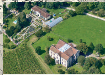
Neues Schloss Teufen und Orangerie.