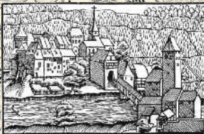
Eglisau von Süden in einem Holzschnitt von Johannes Stumpf um 1547.