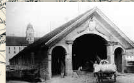
Die 1810 erbaute alte Holzbrücke. Aufnahme von 1913.