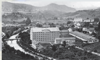
Die Spinnerei Blumer, aufgenommen 1860.